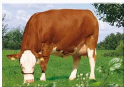
IDOL - Else

Out of 1,2 Mio. Simmental cows in Germany 5.000 bull dams qualify for planned matings with the best sires. 500 young sires out of these matings are tested per year and have to prove their qualities in milk & beef performance and in a number of fitness traits (longevity, somatic cell counts, fertility, stillbirth rate, calving ease, milking speed, persistency) through their progenies. In addition to these major traits we select the most suitable bulls for tropical and subtropical areas according to their colour and eye pigmentation.