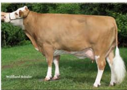
HOGIT ET - Lisa

Out of 1,2 Mio. Simmental cows in Germany 5.000 bull dams qualify for planned matings with the best sires. 500 young sires out of these matings are tested per year and have to prove their qualities in milk & beef performance and in a number of fitness traits (longevity, somatic cell counts, fertility, stillbirth rate, calving ease, milking speed, persistency) through their progenies. In addition to these major traits we select the most suitable bulls for tropical and subtropical areas according to their colour and eye pigmentation.