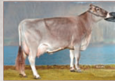
Hussli - daughter HAPPY Dam of the young sire DYNAMO 4/3,1: 10789 4,54 % 490 3,89 % 420

A.I. stud Greifenberg: www.greifenberg-genetics.de A.I. stud Memmingen: www.rinderbesamung-memmingen.de RBW / A.I. stud Herberlingen: www.rind-bw.de