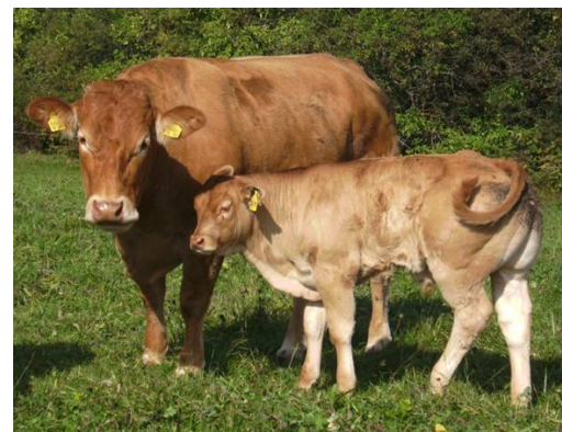
Sohn von VAGNER - 7 Wochen alt ! Viel Wachstum.